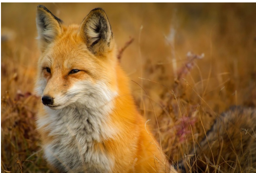
NE PAS NOURRIR UN ANIMAL SAUVAGE