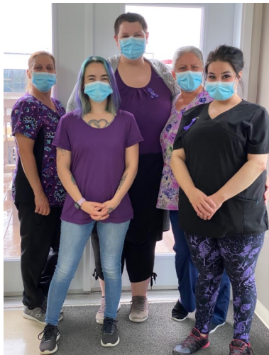
Des employées de la Résidence Villa Port-Cartier portent le mauve.

La dénonciation et le signalement de situations de maltraitance doivent se poursuivre tout au long de l'année. Merci de prendre soin de nos précieux aînés!