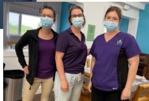
À la Résidence le Boisé aux Escoumins