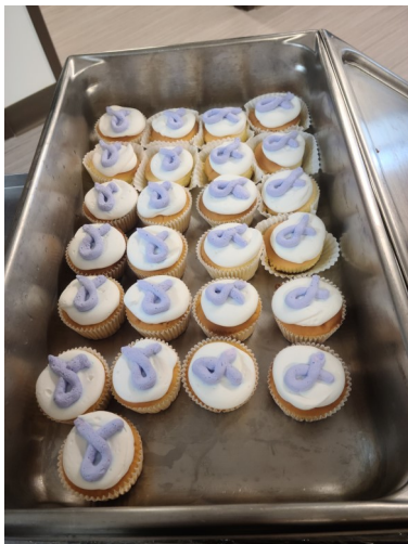
Des cupcakes avec le ruban mauve, symbole de la Journée, au CHSLD de Sept-Îles