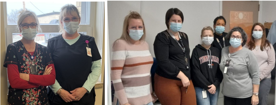
Photo 4 : Une partie de l'équipe des auxiliaires familiales à Les Escoumins