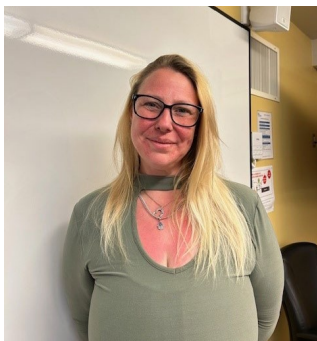
agentes administratives au sein de l'équipe.

Elles sont le bras droit et la main droite de tous les dossiers chapeautés par l'équipe. Que ce soit du traitement de texte, saisie de données, gestion et manipulation des logiciels et des plateformes de formation, soutien administratif ainsi que la création de tout document professionnel, elles savent amener l'équipe à la réalisation de son plein potentiel grâce à leurs talents complémentaires. L'arrivée des Fêtes n'a rien