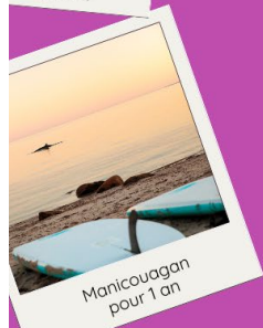
Manicouagan pour 1 an