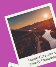
Haute-Côte-Nord jusqu'à l'automne