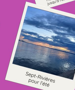
Sept-Rivières pour l'été