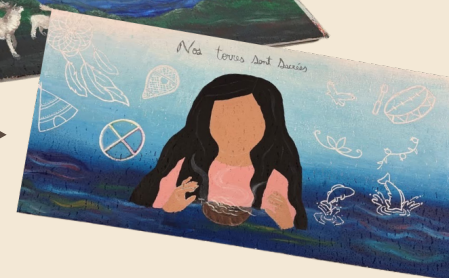
Oeuvre en psychiatrie ►