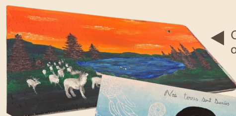
◀ Oeuvre en oncologie