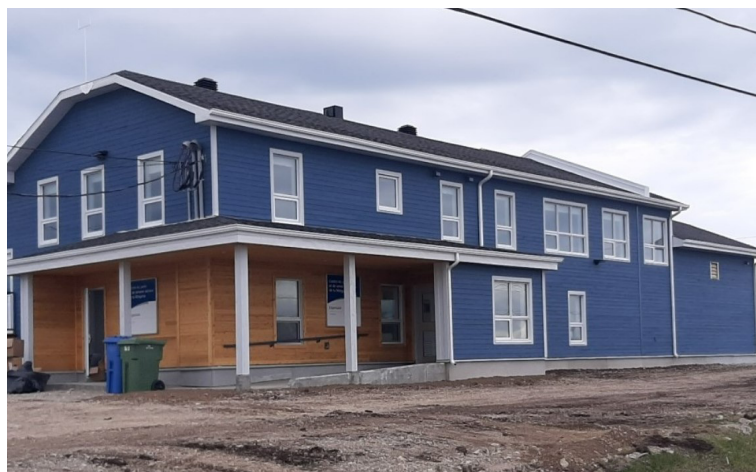
CLSC de Port-Menier