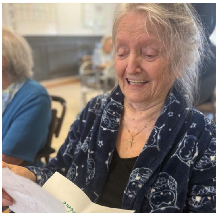
Une résidente qui lit une des lettres des jeunes du camp de jour.