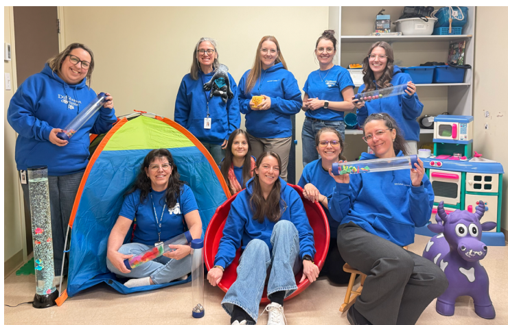
4, des Pilotes - Les Escoumins (avec deux intervenantes de la DPJ qui se sont jointes à la photo!)