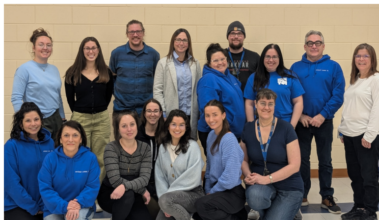
1250, Lestrat - Baie-Comeau