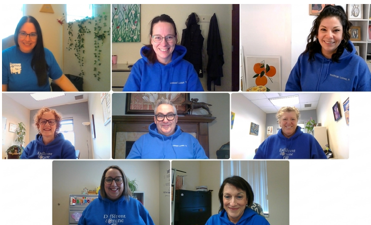
Équipe de gestion - DI-TSA-DP