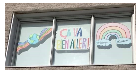
Équipe DPJ à Sept-Îles