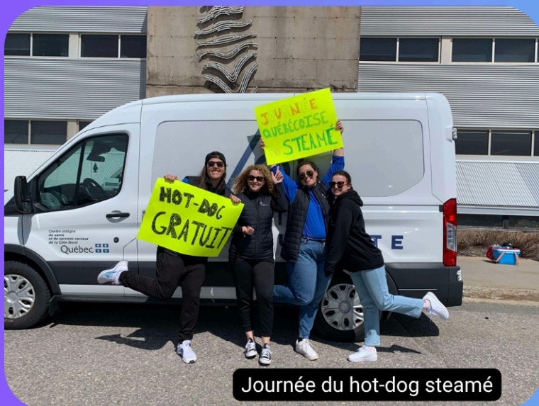
Journée du hot-dog steamé

CAR NOUS AVONS À CŒUR D'OFFRIR DES SERVICES, DES ACTIVITÉS ET DE PARTICIPER AUX ÉVÈNEMENTS DE NOS PRÉCIEUX PARTENAIRES ET COLLABORATEURS !