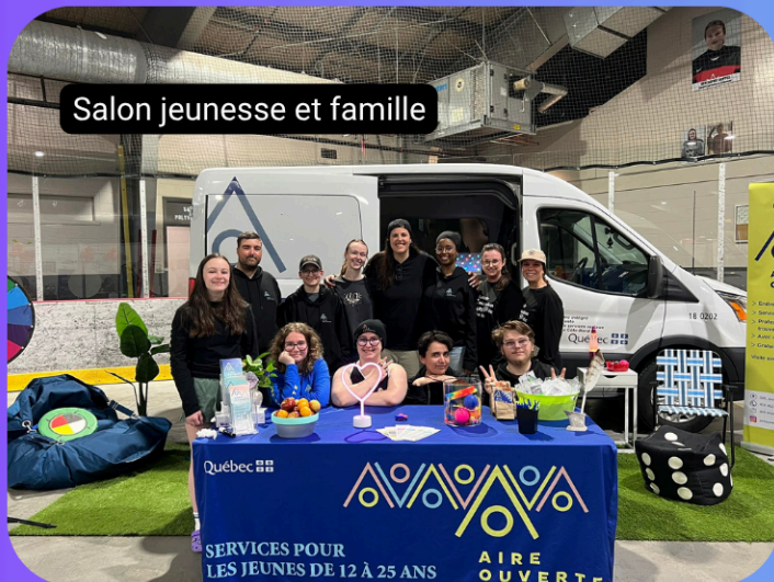
Salon jeunesse et famille