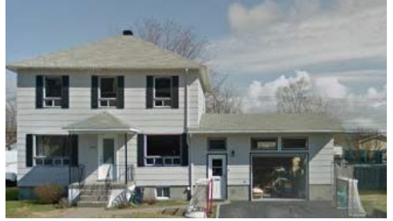
Immeuble du 610, boulevard Jolliet à Baie-Comeau

Cette acquisition permettra de répondre à des besoins liés à la situation de la COVID-19, incluant les besoins en ressources humaines, dont les médecins dépanneurs. Ce bâtiment est situé à moins de 100 mètres de l'Hôpital Le Royer.