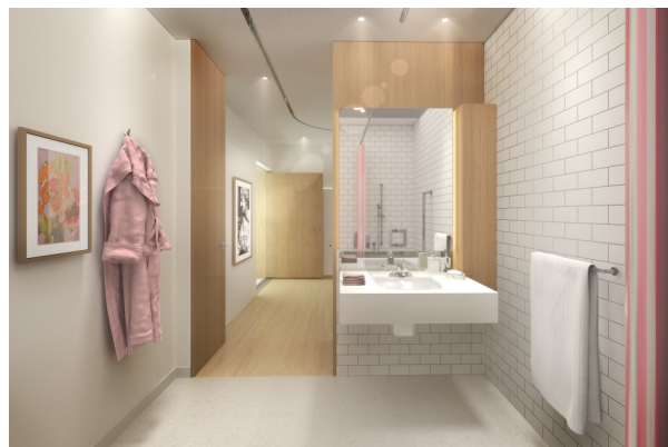
Salle de bain dans une maison des aînés et alternative

La construction d'une maison des aînés et alternative est aussi prévue à Baie-Comeau. Elle comportera 48 places, soit 24 pour des aînés et 24 pour des adultes ayant des besoins spécifiques.